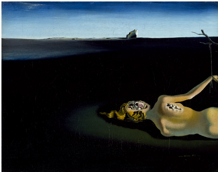
Salvador Dalí, Mujer durmiendo en un paisaje, 1931