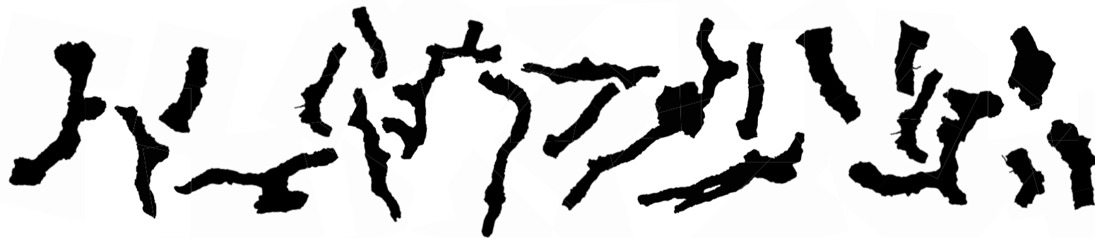
Schüttloch (Gips 1*, 2, 7, 8, 10-17, 22-24, 28-32, 34-36), 2023 Gips Plaster