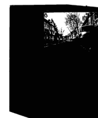
Parallel, 2008 2-Kanal-Videoinstallation, PAL, Farbe, Ton 2-channel video installation, PAL, color, sound 13:29 min