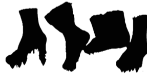
Investigate (3), 2024* Bronze