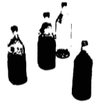
Untitled, 2023 Glas, Holz, Pilzmyzel Glass, wood, mushroom mycelium