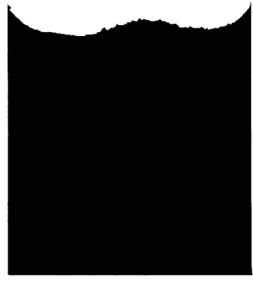
Insomnia, 2024 Sand