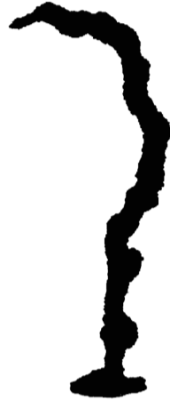
Schüttloch (2), 2022* Bronze