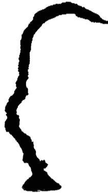
Schüttloch (6), 2022* Bronze