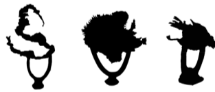
Roadkill (Snake / Hedgehog / Sparrow), 2023 Bronze