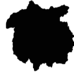
Schüttloch (Gips 5), 2023 Gips Plaster