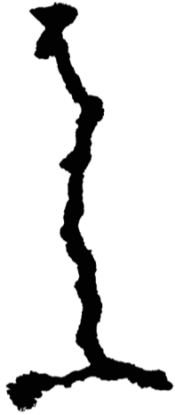
Schüttloch (2), 2023* Aluminium Aluminum