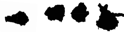
Schüttloch (Gips 25, 26, 27, 33), 2023 Gips Plaster