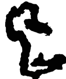
Schüttloch (6), 2012 Aluminium Aluminum