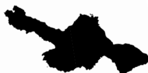
Schüttloch (Gips 4), 2023 Gips Plaster