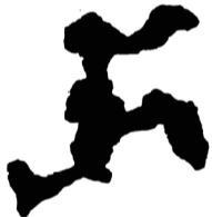
Schüttloch (Gips 6), 2023 Gips Plaster