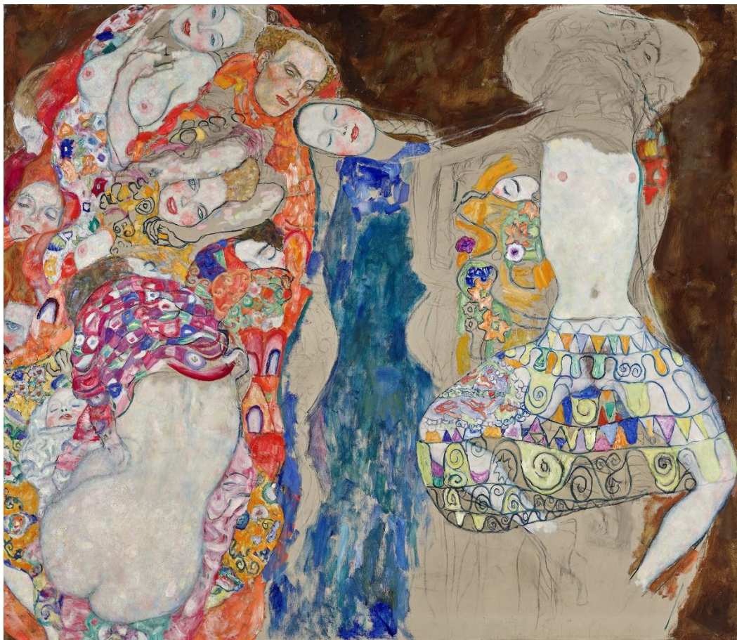
Gustav Klimt, Die Braut , 1917/18 (unvollendet) Klimt-Foundation, Wien, Leihgabe im Belvedere, Wien

Oberes Belvedere 15. Mai bis 5. Oktober 2025