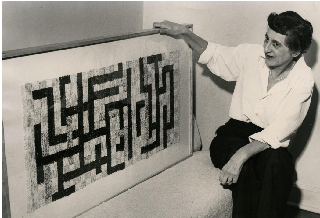
Anni Albers mit ihrer Arbeit Two, New Haven, Connecticut, 1952

Unteres Belvedere 30. April bis 16. August 2026