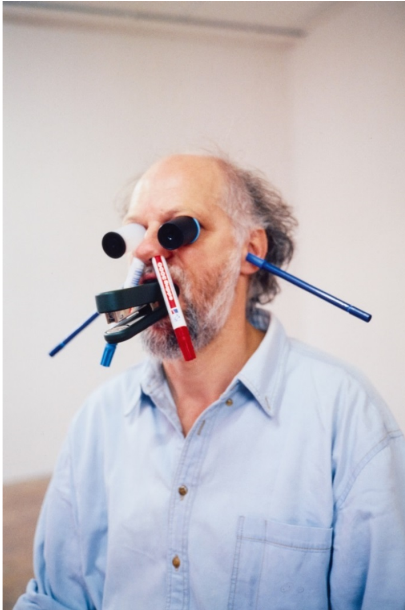
Erwin Wurm, One Minute Sculpture , 1997/2005, Belvedere, Wien